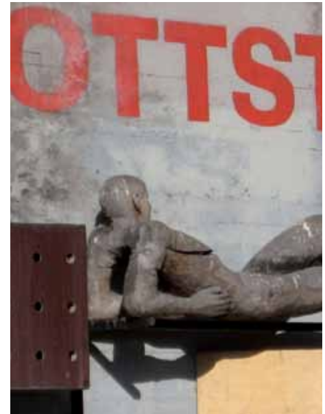
1 Theater und Galerie Rottstraße, Bochum

Das M:AI möchte mit KunstLaboren auch im Jahr 2012, im Herbst, die interessierte Öffentlichkeit für Fragen der Stadtentwicklung sensibilisieren, die Auseinandersetzung mit der Stadt fördern und Kunst und Künstler als Faktor für Stadtgestaltung vorstellen. Haben sich die KunstLabore 2010 und 2011 in größeren Städten in NRW umgesehen, so soll in 2012 die Situation in einer der vielen Mittel- oder Kleinstädte im Norden des Landes im Blickpunkt stehen. Genaues Format und Ort der nächsten KunstLabore werden im Frühjahr bekannt gegeben.