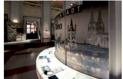
1 Foto: Claudia Dreyse

Eine Kooperation des M:AI mit der Regionale 2010 und dem Kolleg_Stadt_NRW.