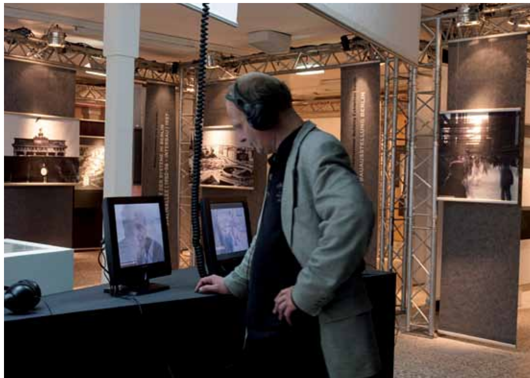
1_ IBA meets IBA in Hamburg